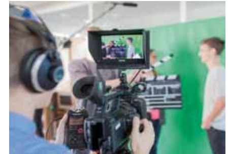
Den eigenen Werbespot produzieren