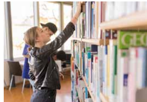
Recherchieren in unserer Bibliothek