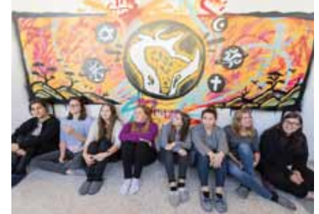
Der Ausbildungszweig für kreative Köpfe