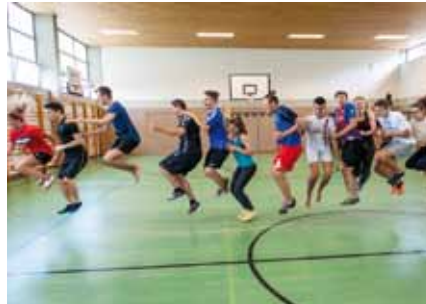
Bist du fit für die Sport HAK?