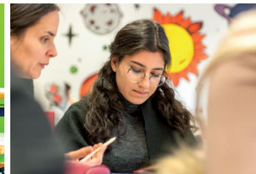
Gemeinsam(e) Ziele erreichen