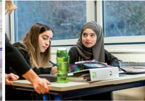
Gruppenarbeit macht Spaß!