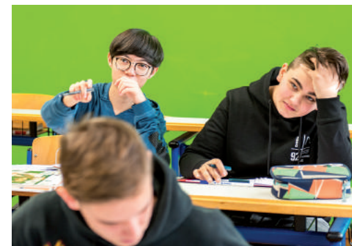
Kooperatives Arbeiten: Aufgaben miteinander lösen