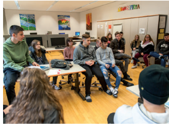
Fit für den Beruf durch die Übungsfirma