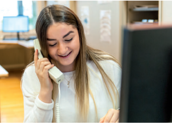
Wertvolle Erfahrungen im Betriebspraktikum