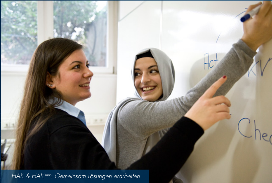
HAK & HAK neu : Gemeinsam Lösungen erarbeiten