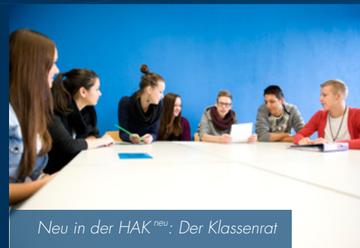
Neu in der HAK neu : Der Klassenrat